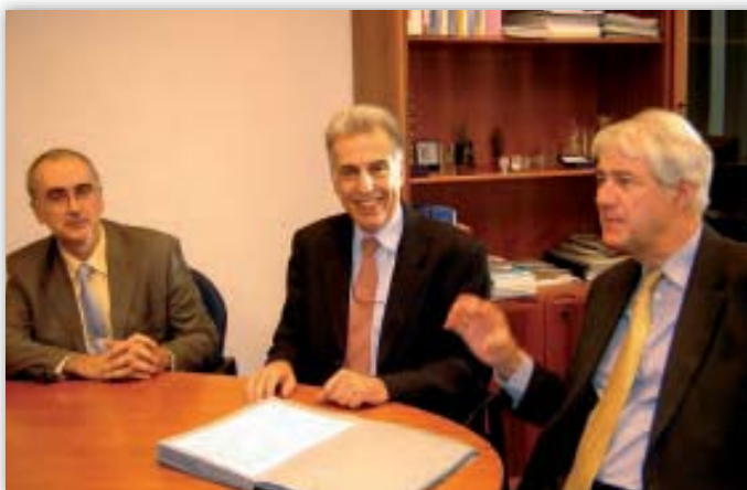
Peter Hustinx, P. Nikiforos Diamandouros en Joaquín Bayo Delgado, na de ondertekening van het Convenant.

Om dubbel werk te voorkomen en een zo consistent mogelijke aanpak van de in klachten aan de orde gestelde algemene en specifieke gegevensbeschermingsproblematiek te bewerkstelligen, hebben de Europese Ombudsman en de EDPS in november 2006