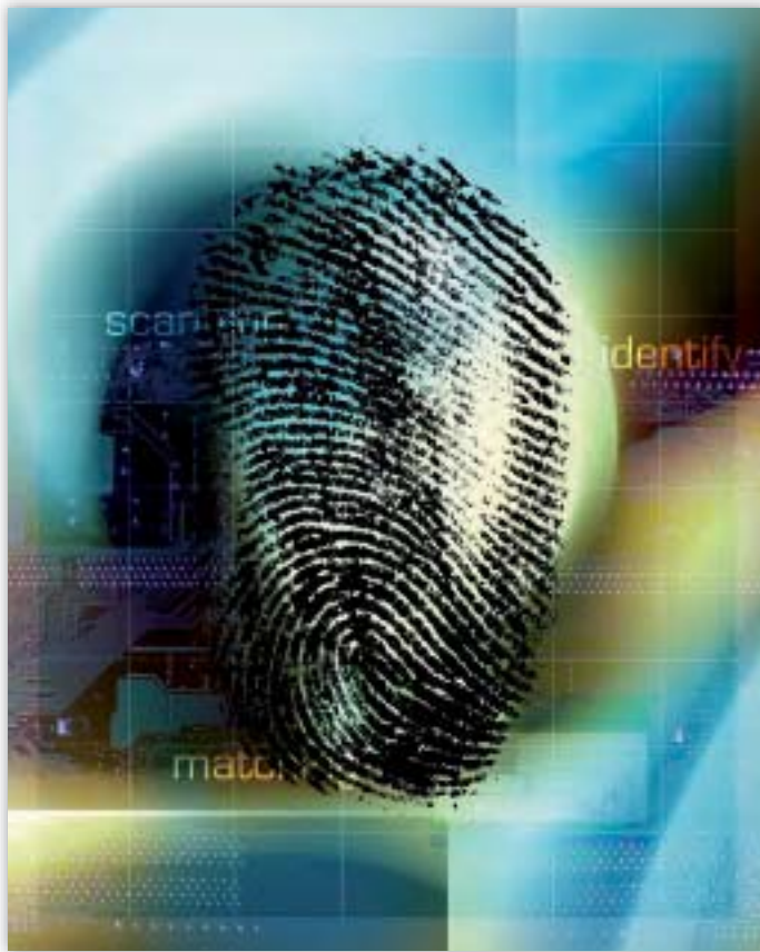
Het systeem van Eurodac bevat meer dan 250 000 vingerafdrukken.

name om de inspectie van Eurodac en het grote aantal „speciale zoekopdrachten” (30) . Ook de Commissie en het Europees Parlement hebben gevraagd dit punt te verduidelijken. Een van de voornaamste doelstellingen van de samenwerking met de nationale gegevensbeschermers was de situatie te onderzoeken en desnoods recht te zetten.