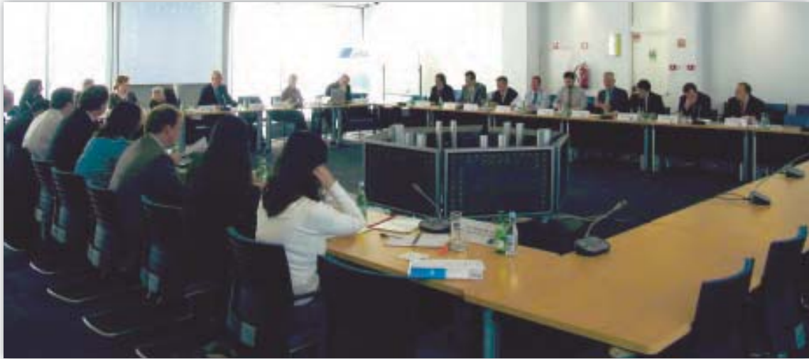
De EDPS woont een bijeenkomst van het DPO-netwerk bij in Lissabon.

De DPO's komen al enkele jaren regelmatig bijeen om ervaringen uit te wisselen en horizontale kwesties te bespreken. Dit informele netwerk is de samenwerking ten goede gekomen en werd in 2006 gecontinueerd.