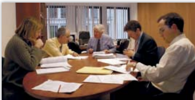
Een deel van het beleidsteam tijdens de afronding van een wetgevingsadvies

Tot slot was ook de kwaliteit van de gegevens een belangrijk horizontaal thema. De gegevens moeten zeer nauwkeurig zijn, om onduidelijkheid over de inhoud van de verwerkte gegevens te voorkomen. Daarom moet de nauwkeurigheid regelmatig goed worden gecontroleerd. Bovendien betekent hoge gegevenskwaliteit niet slechts een basisgarantie voor de betrokkene, maar bevordert zij ook een efficiënt gebruik door de gegevensverwerker.