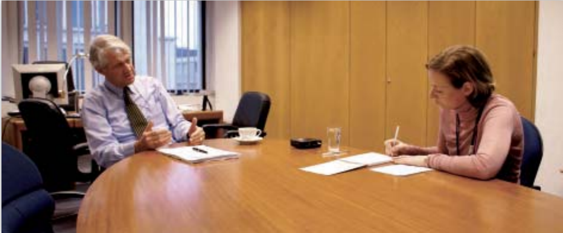
Peter Hustinx wordt geïnterviewd door een journalist.

Op deze druk bijgewoonde conferentie legden zij uit wat de EDPS onderneemt om de instellingen en organen van de Gemeenschap hun eigen verplichtingen qua gegevensbescherming te doen naleven, en wat zijn adviestaak met betrekking tot wetgeving en beleid behelst. Daarnaast werden in 2006 meer dan 20 interviews gegeven aan de schrijvende en de audiovisuele pers. Het merendeel van de interviews werd aangevraagd door de „EU-pers”, dus media die over de EU berichten voor een doelgroep die zich met EU-aangelegenheden bezighoudt. Toch waren er ook vraaggesprekken met meer nationaal georiënteerde media, omdat de EDPS de wereld buiten Brussel wil bereiken en tot op zekere hoogte aanwezig wil zijn in het nationale debat. Drie voorbeelden hiervan zijn de Duitse en de Zweedse radio en een Sloveens dagblad.