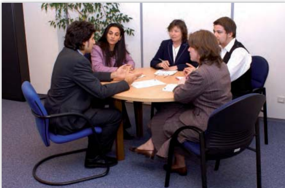
Een deel van het personeelsteam bespreekt een dossier.

Met name wat de comptabiliteit betreft heeft de Commissie verder assistentie verleend, want als rekenplichtige is de rekenplichtige van de Commissie aangesteld.