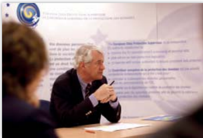
Peter Hustinx tijdens een bijeenkomst met de staf

Daarbij bleek er gegronde reden te bestaan voor een uitbreiding van het terrein waarop de EDPS advies uitbrengt. Dit terrein was tot de zomer van 2006 vooral beperkt gebleven tot wetgevingsdocumenten van het directoraat-generaal Justitie, vrijheid en veiligheid bij de Commissie, over de ruimte van vrijheid, veiligheid en recht. Bij de opstelling van de lijst konden de contacten met het secretariaat-generaal van de Commissie, het DG Informatie-maatschappij en media (INFSO) en het Europees Bureau voor fraudebestrijding (OLAF) worden versterkt en konden ook contacten worden gelegd met het DG Werkgelegenheid, sociale zaken en gelijke kansen (EMPL) en het DG Gezondheid en consumentenbescherming (SANCO). Al deze instanties waren bij de opstelling van de lijst betrokken.