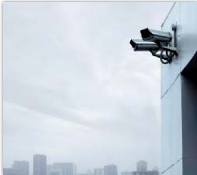
Het aantal bewakingscamera's is de afgelopen jaren toegenomen.

Tegen het Europees Parlement werd een klacht ingediend (2006-95) wegens de mogelijke bekendmaking van het huisadres van geaccrediteerde lobbyisten. Uit het formulier waarmee een lobbyistenpasje werd aangevraagd viel af te leiden dat het huisadres moest worden ingevuld. Verder in het formulier stond namelijk te lezen dat de daaronder gevraagde informatie niet openbaar zou worden gemaakt, wat inhield dat het voorafgaande — onder meer het huisadres — wél gepubliceerd zou worden.