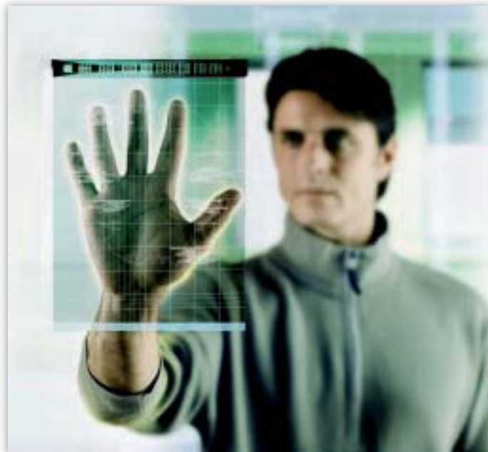
Als deel van de opdracht van de EDPS worden nieuwe technologische ontwikkelingen gevolgd die invloed kunnen hebben op de bescherming van persoonsgegevens.

Tijdens de internationale conferentie van commissarissen voor gegevensbescherming en privacy, in november te Londen (47) , werd mede door de EDPS het voorstel geopperd om de bescherming van de individuele vrijheden op dezelfde leest te schoeien als die van het milieu. „Misschien zijn privacy en gegevensbescherming wel even kostbaar als de lucht die we inademen: ze zijn even onzichtbaar, maar het gemis ervan kan even rampzalig zijn.” Bewaking is aldus gezien te vergelijken met verontreiniging; de expertise die de EU bij de preventie en beheersing van verontreiniging heeft verworven (48) met behulp van BBT, zou zeer nuttig kunnen blijken om de gevaren van een gecontroleerde samenleving tegen te gaan.