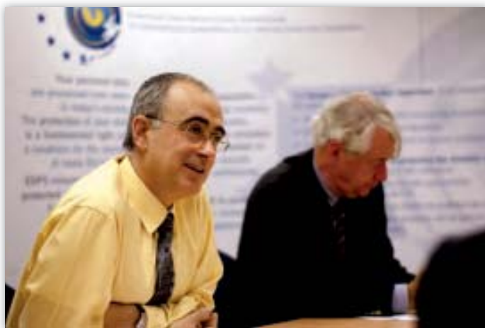
De adjunct-EDPS Joaquín Bayo Delgado tijdens een bijeenkomst met de staf.

Wat zijn bevoegdheden betreft, heeft de EDPS tot dusver geen bevel, waarschuwing of verbod laten uitgaan. Het volstond om — zowel bij voorafgaande controles als bij klachten — zijn visie te geven in de vorm van aanbevelingen. De verwerkingsverantwoordelijken hebben deze aanbevelingen uitgevoerd of te kennen gegeven dat ze zullen doen en ondernemen nu de nodige stappen. De snelheid van de reactie verschilt van geval tot geval. De opvolging van de aanbevelingen wordt door de EDPS nu aan een systematische voortgangsbewaking onderworpen.