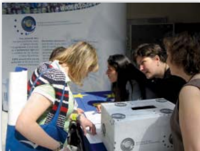
De EDPS-staf bemant de stand in het Europees Parlement tijdens de Open Dag op 6 mei 2006.

Voor de Open Dag en andere gelegenheden beschikt de EDPS over een stand en publiciteitsmateriaal (pennen, post-its, USB-sticks). De stand was opgesteld in het Europees Parlement; meer dan 200 mensen namen er deel aan een quiz, waarbij zich discussies ontsponnen over privacy en gegevensbescherming in Europa.